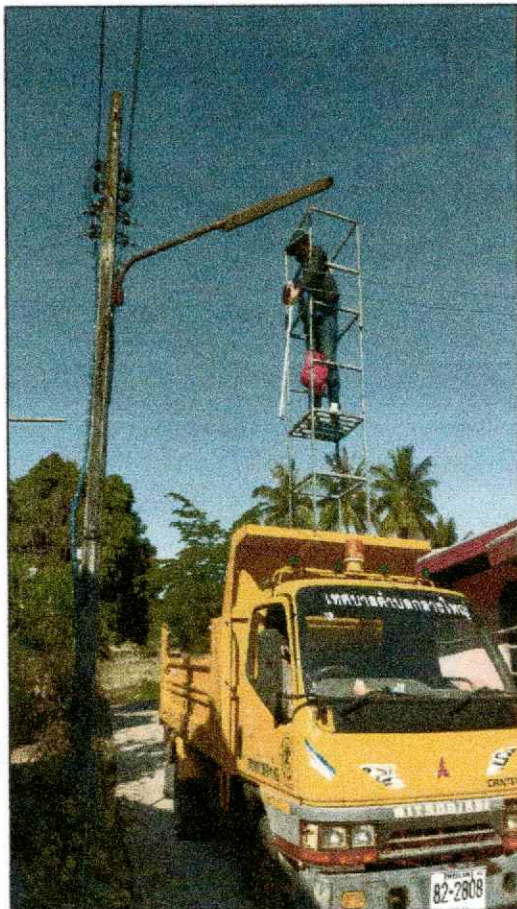
ดำเนินการแก้ไข

บ้านกลางใหญ่ หมู่ที่ ๑๒ จำนวน ๑ จุด ใช้ขั้วหลอด จำนวน ๔ ขั้ว และหลอดไฟแอลอีดี ๑๘ วัตต์ จำนวน ๒ หลอด