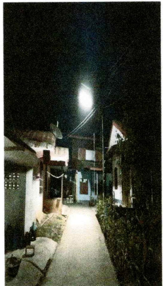
หลังดำเนินการแก้ไข